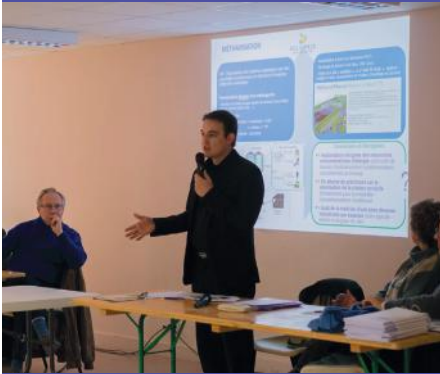
Réunion d'information sur le projet de méthanisation à Moussy le Neuf