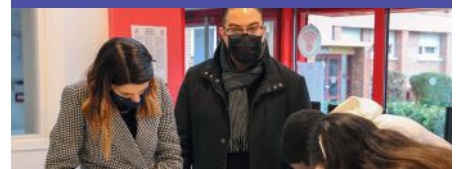
Signature d'une convention avec la ligue de l'enseignement