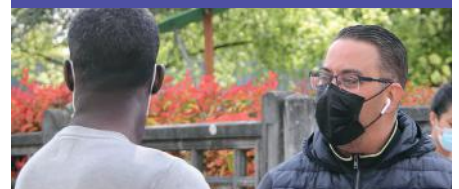
Campagne de sensibilisation pour la sécurité des enfants aux abords des écoles