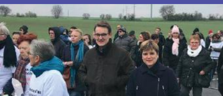
Manifestation pour le rond point sur la RN300 à Saint Pathus

J'ai 42 ans, j'ai grandi en Seine et Marne, et plus particulièrement à Saint-Pathus où je suis conseillère municipale depuis 2008. Après avoir été consultante auprès des comités sociaux et économiques dans un cabinet d'expertise comptable, je me suis reconvertie dans l'insertion professionnelle. Très tôt, j'ai pris conscience de la nécessité de m'engager pour ne plus être spectatrice et défendre mon territoire, trop souvent malmené par les politiques publiques.