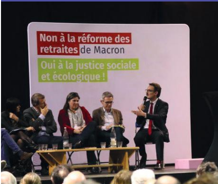
Meeting contre la réforme des retraites