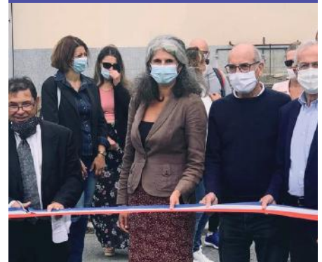
Inauguration de la rénovation du terrain de football à Compans