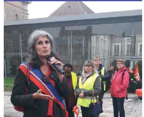
Soutien aux revendications des salariés du Département à Melun