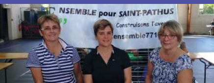
Forum des associations à Saint Pathus